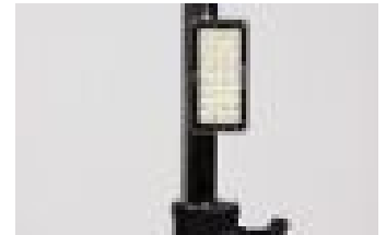
四隅の強力磁石での固定も可能